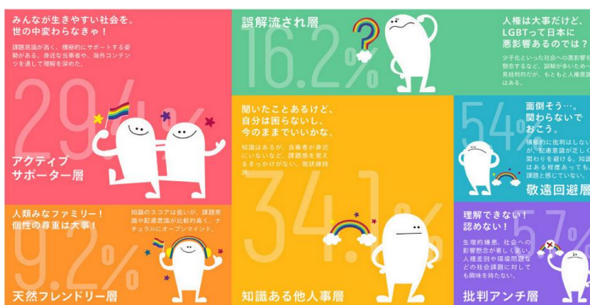
上下とも電通ウェブサイト：電通、「LGBTQ+調査2020」を実施