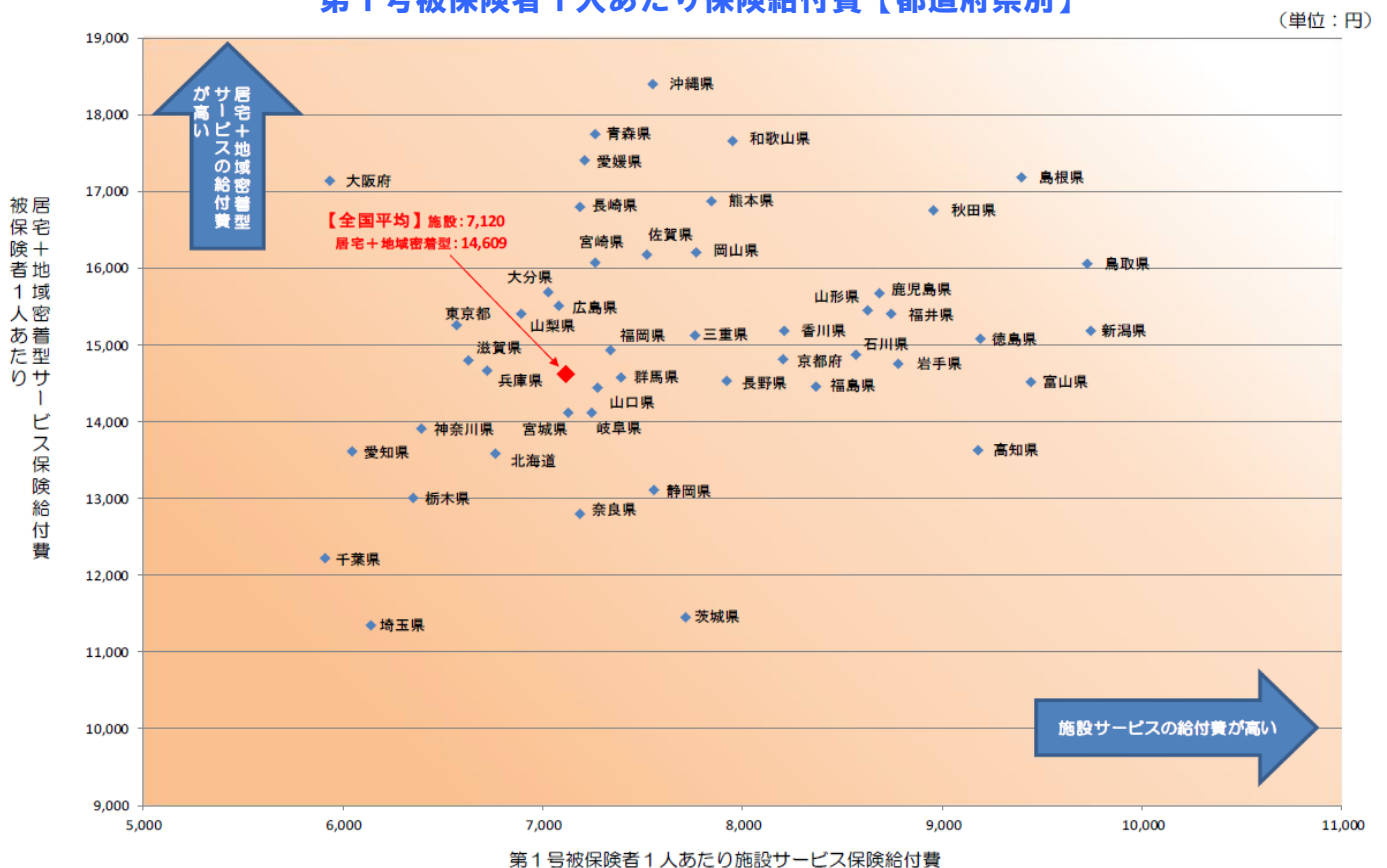
第1号被保険者1人あたり保険給付費【都道府県別】

（特定入所者介護（介護予防）サービス費は、国民健康保険団体連合会から提出される現物給付分のデータと保険者から提出される償還給付分のデータを合算して算出した値である）