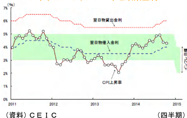
フィリピンのインフレ率と政策金利

また、ミンダナオ島のインフラ整備予算は過去最高の630億ペソ計上され、農地・食品加工場・港湾を結ぶ交通網の整備が予定される。